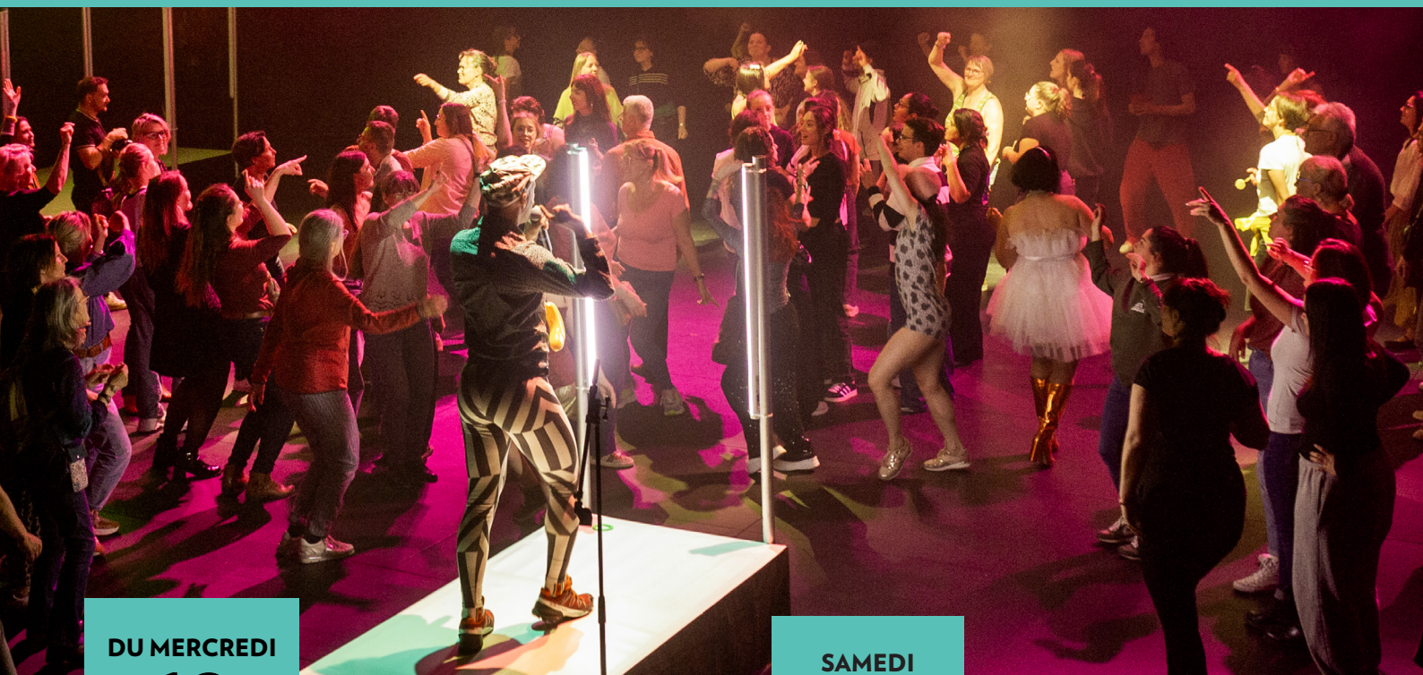
Karadance, Collectif ÈS

Avec le Kararocké ou le Karaodance, le public franchit une étape supplémentaire : celle de la scène. Seul ou en groupe, chacun devient interprète, dans une ambiance festive et libérée, où la performance devient un jeu collectif.