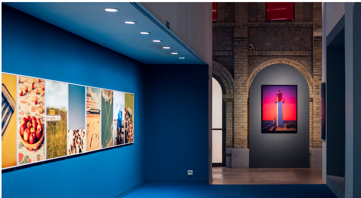
Festival Planches Contact 2024

Avec plus de 10 000 visiteurs sur les deux premières semaines le festival se positionne comme un événement incontournable, réunissant les amateurs d'art autour de visions photographiques audacieuses et inspirantes.