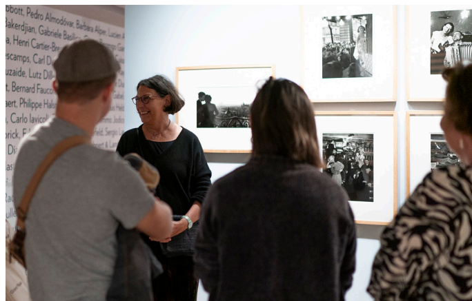
Le Siècle des vacances

Enfin, cette générosité est celle des photographes eux-mêmes, qui, année après année, reviennent fidèlement au festival pour partager leur passion et créer des liens durables avec le public. En 15 ans, Planches Contact a su créer une véritable famille de photographes et de passionnés qui se retrouvent à chaque édition pour célébrer ensemble l'art de la photographie.