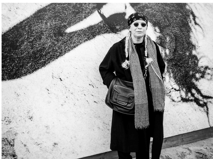
Dominique Issermann