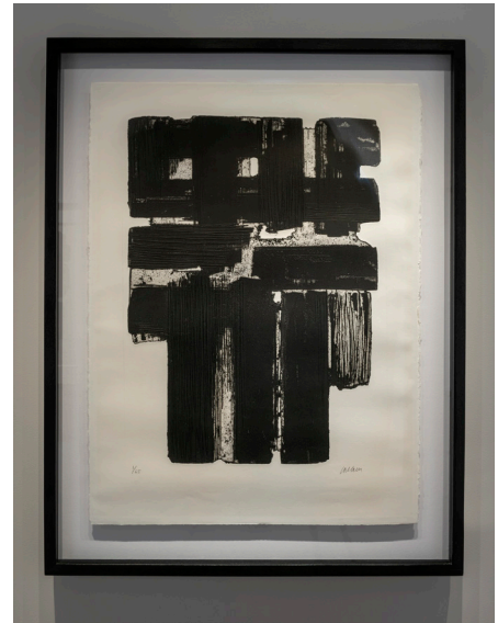
Pierre Soulages, Eau-forte XB Eau-forte, épreuve signée et numérotée 1/6 Collection Claude C. © Adagp, Paris, 2023