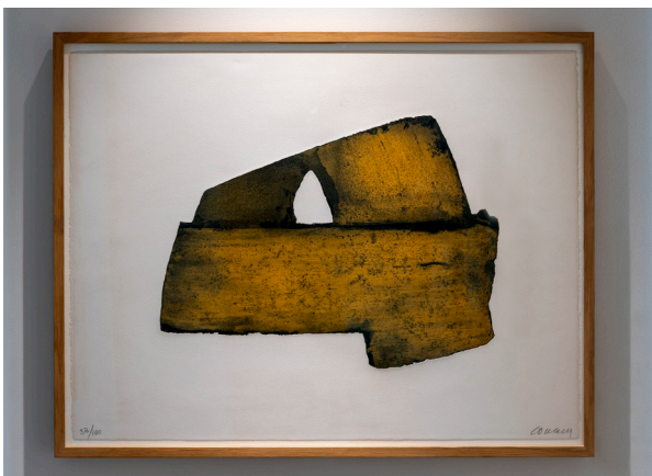
Pierre Soulages. Eau-forte XX Eau-forte, épreuve signée et numérotée 33/100 Collection Claude C. © Adagp, Paris, 2023