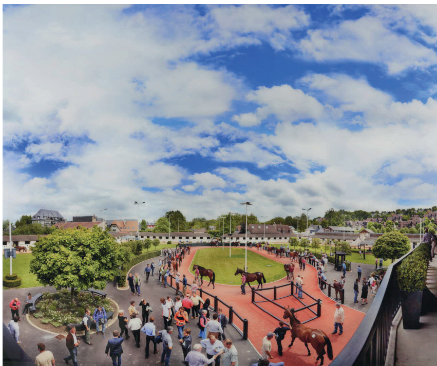
Simon Procter - Série Faraway , 2012 Tirage contrecollé sur Dibond et sous verre acrylique H. 150 x l. 180 cm Festival Planches Contact, Ville de Deauville, Les Franciscaines

La relation entre Deauville et le monde équestre est profonde, historique et en constante évolution. Grâce à un leadership engagé, à des partenariats stratégiques et à une passion inébranlable, la ville continue de célébrer et de préserver son héritage équestre unique, assurant ainsi sa place de choix dans le monde équestre.